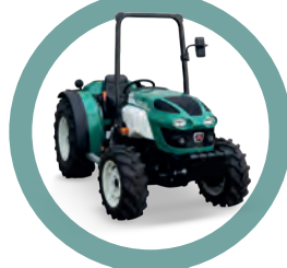
Traktoren für Obstplantage/Weinberg