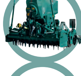
Sämaschine für Getreide