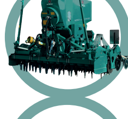
Seminatrici per cereali