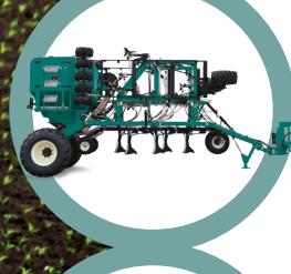
Seminatrici pneumatiche per semina diretta